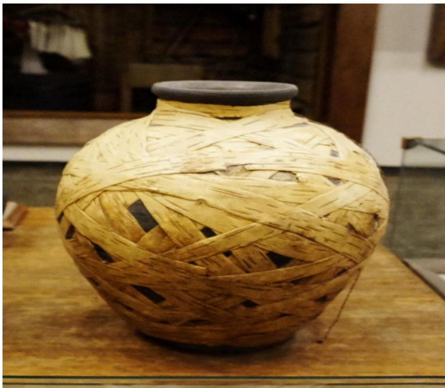
Горшок, обмотанный берестой. Коллекция Русского музея

Молод был – семью кормил, а старый стал – пеленаться стал.